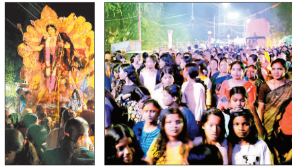
विसर्जन के लिए एते जाते प्रतिमा। झूमते श्रद्धालु।

कोयलांचल क्षेत्र के चरचा कॉलरी में विजयादशमी के एक दिन बाद शुक्रवार की शाम मां दुर्गा की विसर्जन यात्रा कोलरी में भव्य रूप में निकाली गई। सुभाष नगर स्थित दुर्गा पंडाल से प्रारंभ हुई यात्रा शोभायात्रा में हजारों की संख्या में श्रद्धालु शामिल हुए। विसर्जन यात्रा ढोल-नगाड़ों, डीजे की धुन और जय माता दी के जयकारों से गूंज उठी, जिससे पूरा नगर भक्ति और उत्साह में डूब गया। शोभायात्रा से पूर्व हनुमान मंदिर की दुर्गा प्रतिमा का विसर्जन पारंपरिक छत्तीसगढ़ी शैलजा नृत्य और अबीर-गुलाल के साथ किया गया।