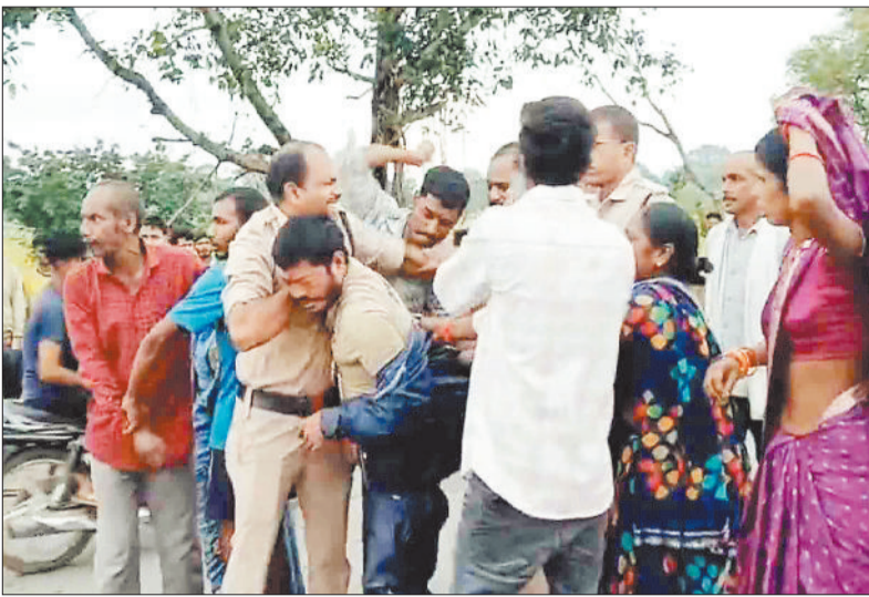
आरोपी को भीड़ से बचाती पुलिस।